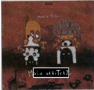
V povezavi z EPK: Mala arhitektka