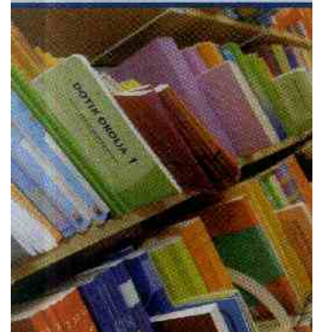
Založniki opozarjajo, da bodo cene učbenikov v prihodnje rasle.

Šolsko ministrstvo naj bi ustvarjalo razmere, ugodne za enega ali dva monopolista, ki bosta obvladovala učbeniško produkcijo.