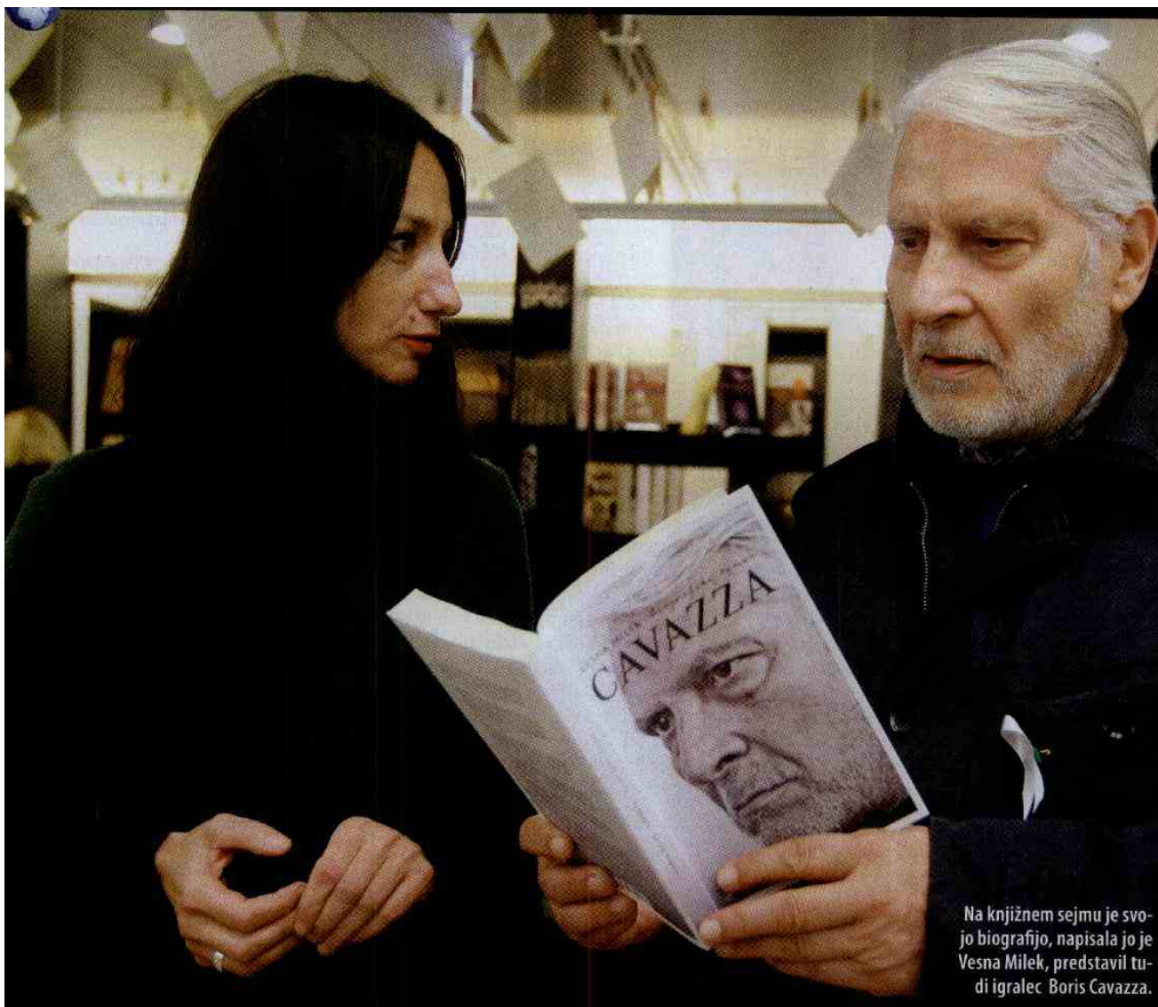
Na knjižnem sejmu je svojo biografijo, napisala jo je Vesna Milek, predstavil tudi igralec Boris Cavazza.