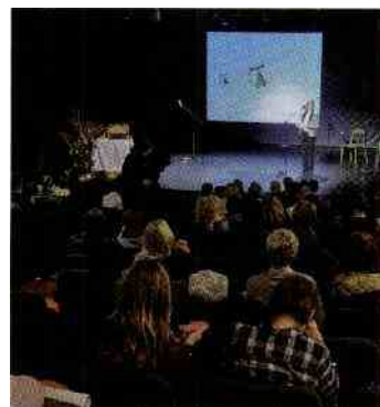
Pionirska je podelila priznanja zlata hruška za mladinsko književnost.