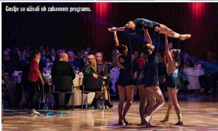
Gostje so uživali ob zabavnem programu.